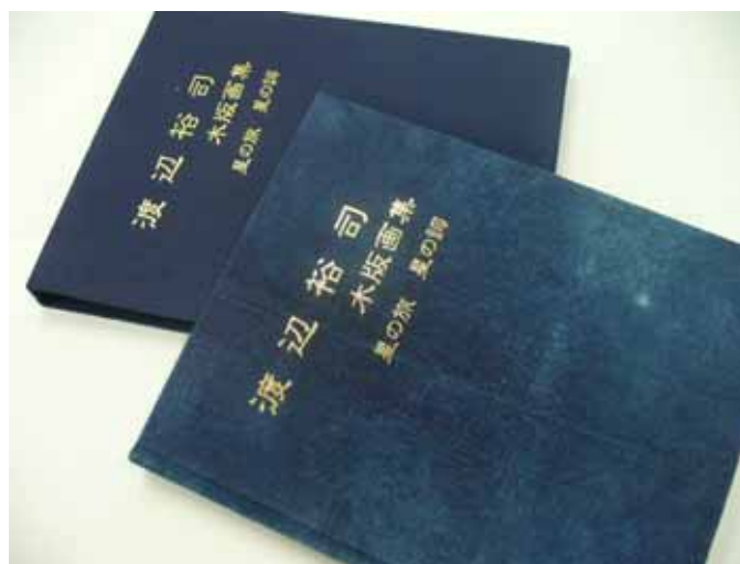
▲表紙に藍の布を使用した手作り製本