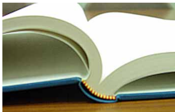
▲美しい丸みを持った手作り製本