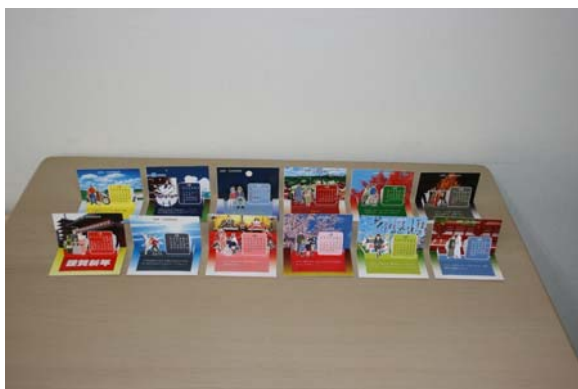
POPUP名刺カレンダータイプ