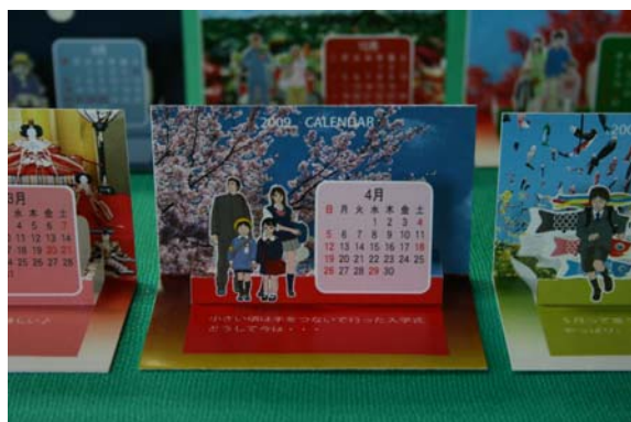
POPUP名刺カレンダータイプ（拡大図）