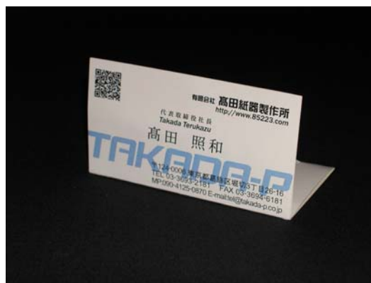
POPUP名刺 表面（名刺部分）