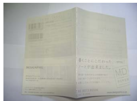
8Pのアスレ製本パンフ