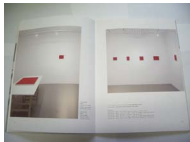
薄物のアスレ製本 開きは抜群！